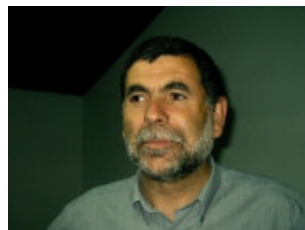
por Serafim Miranda

2) A ORIGEM--A Páscoa originou-se em Deus, com a Sua misericórdia e Seu intuito de livrar o Seu povo. Não somente o plano originou-se com Deus, mas também d'Ele era a revelação do mesmo. A nossa redenção do pecado devemos inteiramente a Deus, bem como a revelação desta graça. Tudo está na mensagem da Palavra divinamente inspirada.