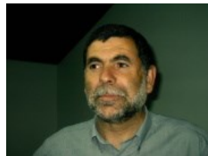
por Serafim Miranda