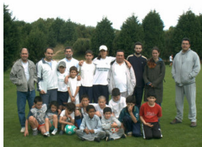
Igreja Monte do Arco & Senhora da Hora

No passado dia 1 de Maio os adolescentes da igreja Monte do Arco e Senhora da Hora realizaram um Encontro Futebolístico no Parque da Cidade. O referido serviu para fortalecer e animar os mais pequenos, que assim, tiveram uma oportunidade de convívio e de praticarem desporto.