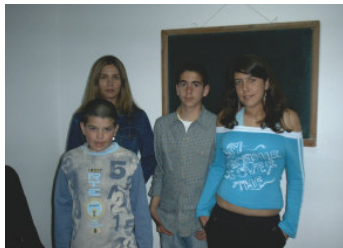
Alguns alunos das aulas de música

Desde Fevereiro que a igreja de Monte do Arco tem dado aulas de música um vez por mês. Habitualmente frequentam as mesmas 6 a 7 alunos, uns aprendendo guitarra outros piano. Alguns já tiveram oportunidade de tocar no louvor numa reunião de domingo, demonstrando assim a toda a igreja os talentos que receberam de Deus, e desenvolvidos nestas aulas, para Sua glória. As próximas aulas serão se Deus permitir nos próximos dias 19 de Junho, 10 de Julho e 14 de Agosto, das 16h às 19h30.